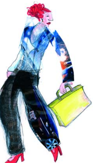
Projekt für BMW Leipzig Gruppenarbeit Projekt for BMW Leipzig Team work