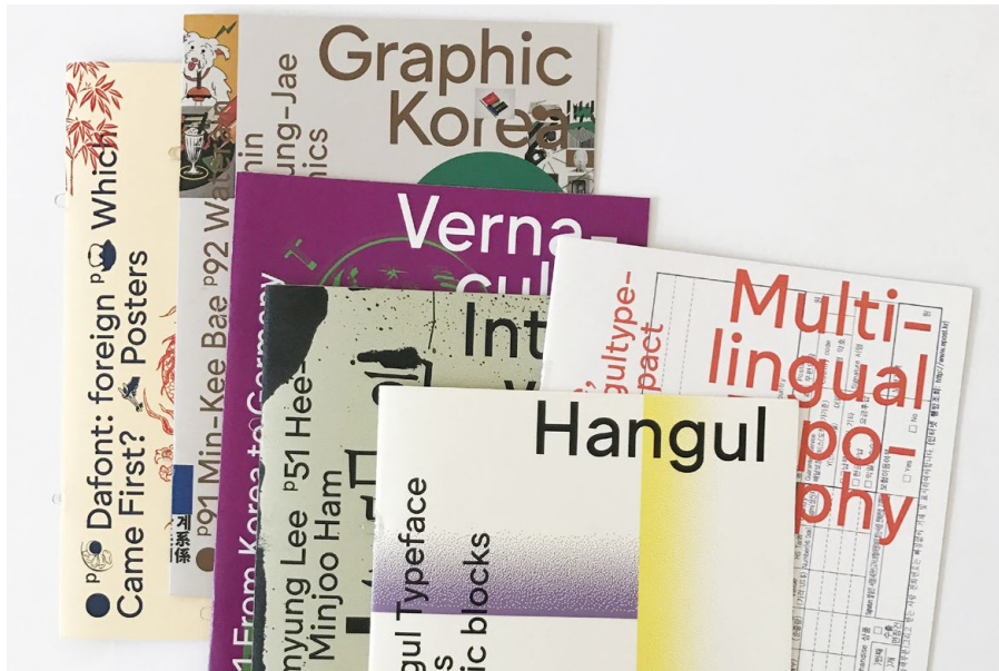
Jihee Lee, Somewhere in Between, entstanden im Sommersemester 2018, Schwerpunkt Schrift und Typografie. Foto: Jihee Lee / Somewhere in Between, Summer semester 2018, type and typography course, Photo: Jihee Lee

The Admission Test is held every March. It is possible to register online from December of the prior year.