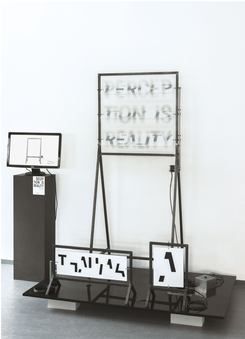
Lena Windisch, Typotrop Typo Typotrop, Bachelor Abschlussarbeit, Sommersemester 2018, Schwerpunkt Schrift und Typografie, Foto: Lena Windisch / Lena Windisch, Typotrop Typo Typotrop, BA degree, Summer semester 2018, type and typography course, Photo: Lena Windisch