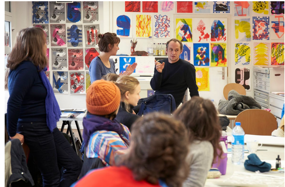
Workshop im Schwerpunkt Illustration, Wintersemester 2019/20 mit Aurélien Débat / Workshop Illustration course, winter semester 2019/20 together with Aurélien Débat . Foto / photo: Martin Hensele