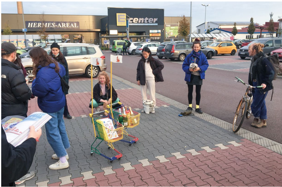
Fantasies of the Supermarket, Gemeinsame Publikation des 2ten Studienjahres, 2019, Foto: Marion Kliesch / Fantasies of the Supermarket, joint publication of the 2nd year of studies, 2019, photo: Marion Kliesch