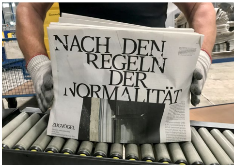
Projekt Schwerpunkt Fotografie und Informationsdesign gedruckt in der Sonderbeilage in der Mitteldeutschen Zeitung 17./18.7.2021 / Project focus on photography and information design printed in the special supplement in the Mitteldeutsche Zeitung 17./18.7.2021.

Exceptionally well-equipped workshops provide ideal conditions for the study programme: from a photo lab and computer pool, the university printing press with offset, lead type, and screen printing workshop to a digital workshop and model workshops for wood, metal, and plastic. At BURG, students also benefit from exchanges with other design and art courses while working on projects and collaborating with students from Fashion Design, Interior Architecture, or Time-based Arts.