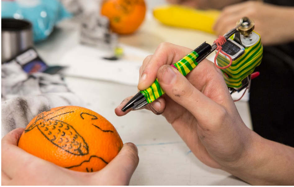
Workshop „How to Knast-tattoo“ im Schwerpunkt Illustration, Wintersemester 2017/18 mit Torsten Illner & Andreas Theile / workshop "How to Knast-tattoo" in the illustration course winter semester 2017/18 together with Torsten Illner & Andreas Theile