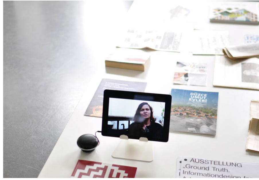
Jahresausstellung „Ground Truth“, Beitrag Schwerpunkt Informationsdesign in Zusammenarbeit mit Beyond Istanbul, 2017 / Annual exhibition, "Ground Truth", work by the study course information design together with Beyond Istanbul, 2017