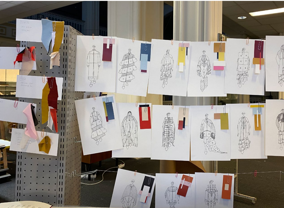
Entwürfe von/designs by Pia Haydn.

Die Studierenden werden durch komplexe Aufgabenstellungen und mit experimentellen wie produktbezogenen Projekten auf verschiedenste Betätigungsfelder innerhalb der Branche vorbereitet – sei es freiberuflich oder in einem Modeunternehmen.