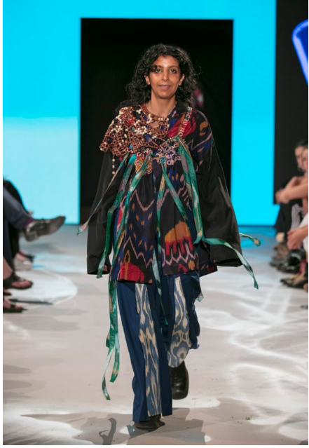
Projekt Rutsi, 2023, Foto / photo: Tim Nowitzki