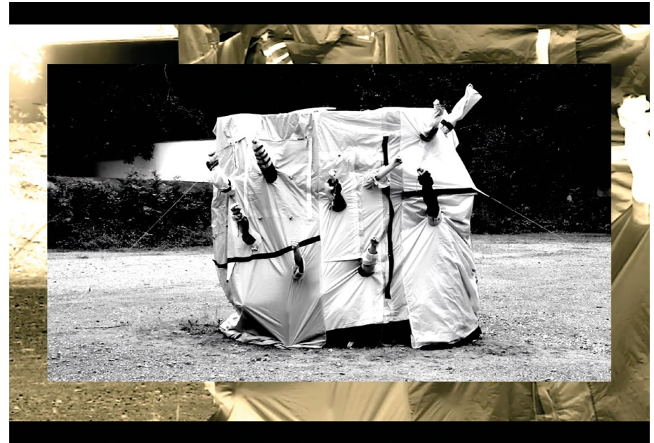
Anna Fenderl, FCK Apocalypse, entstanden im Projekt/developed in the project „Neuland/Science Fiction“. Foto / Photo: Screenshot der Videoarbeit/of the video piece