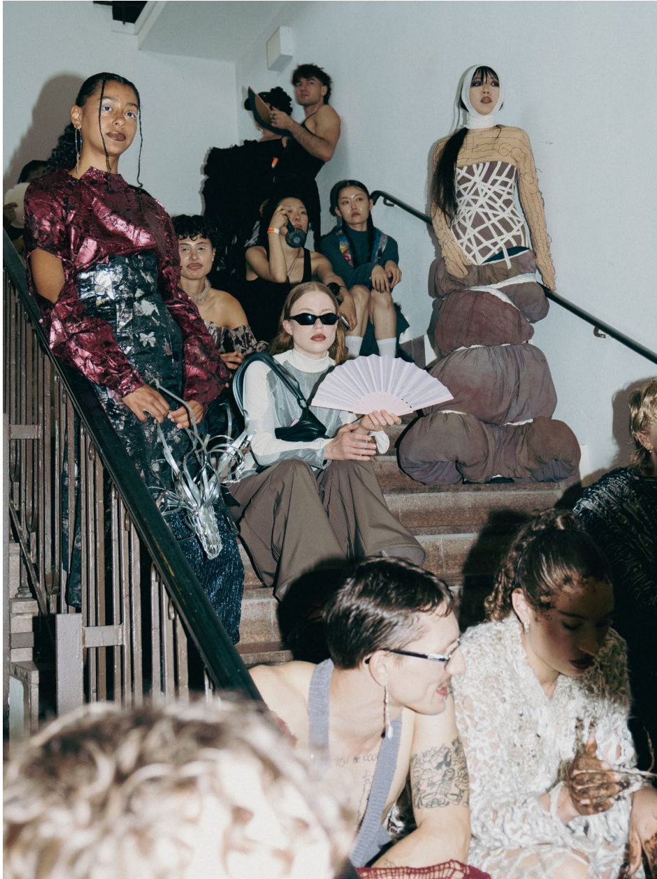
Backstage Wertschau, 2024, Foto / photo: Anna Luisa Richter