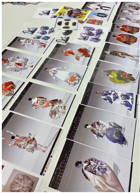
Entwürfe von/designs by Bokyoung Lim.